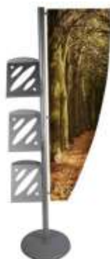
Stojak Graphic & Literature