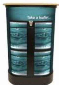
Górny blat za dodatkową opłatą